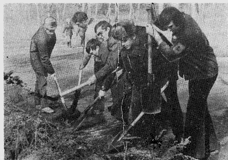
Коллективный труд. Политехники на коммунистическом субботнике.

В. К.: Несомненно. И еще — настойчивость в достижении цели, умение постоять за факультет.